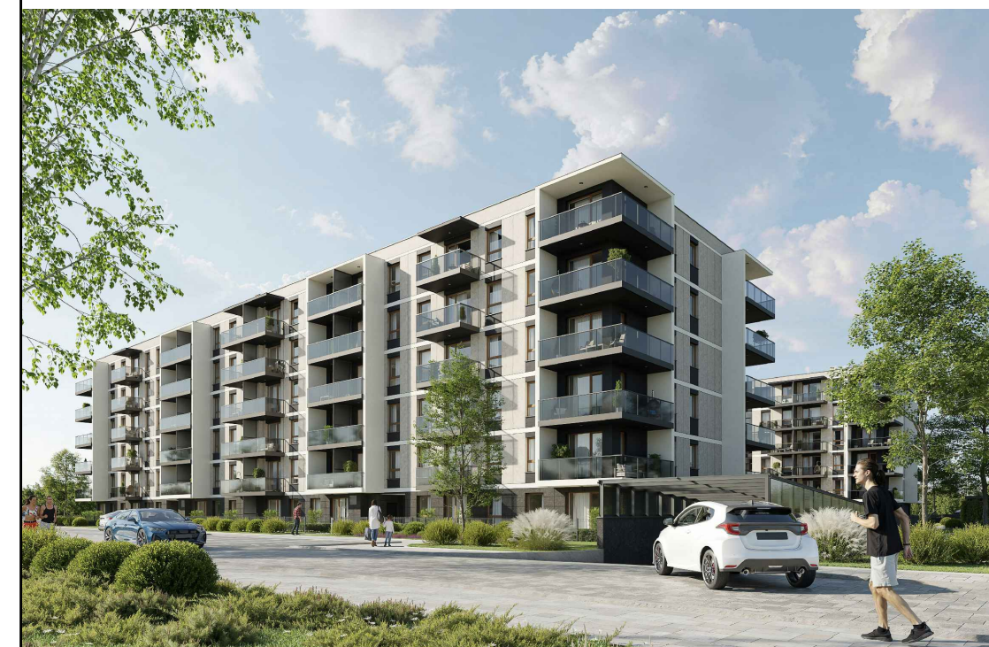
POŁOŻENIE MIESZKANIA W BUDYNKU